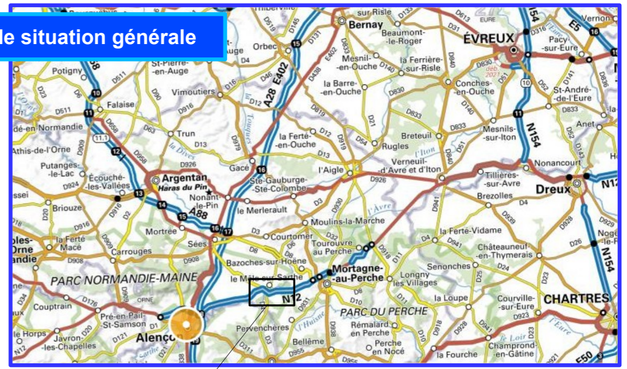
Carte de situation générale

M:\IP_G_R_V_Q\SPT\PESM\Filière Exploitation\Exploitation sous chantier Exploitation sous chantier2024/RN12 bretelles échangeur RD326