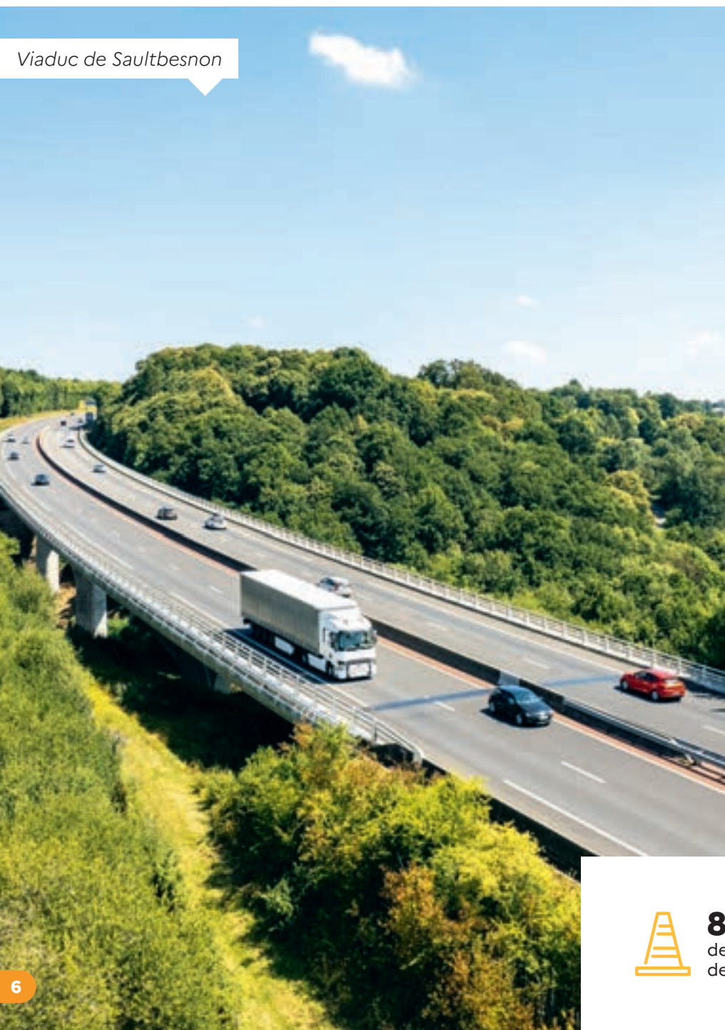
Viaduc de Saulzbesnon